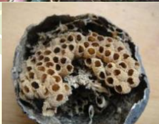
لانه های شفیرگی خالی سرخرطومی جالیز

آدرس دفتر مرکزی: اصفهان - کنارگذر بزرگراه خرازی - حدفاصل سه راه اشرفی اصفهانی ( کهندهز ) و چهارراه صارمیه - ساختمان میلاد_ طبقه دوم شماره تماس: ۰۳۱۹۵۰۱۱۱۳۵-۳۶ کانال تلگرامی: t.me/HayateSabzCo www.Hayatsabz.com